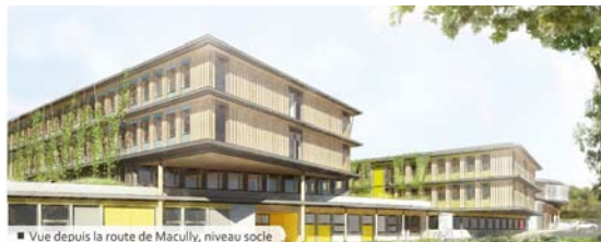
■ Vue depuis la route de Macully, niveau socle

l'aménagement pour chaque pôle d'un espace de détente et de convivialité de proximité, la création de liaisons entre les différents pôles, l'accessibilité de tous les aménagements, et la création d'un espace central de jeux et de rencontre, commun aux différentes filières.